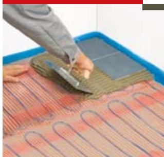
Нанесите плиточный клей

Укладывайте плитку, нанося клеящий состав с помощью епосредственно на мат. Во влажных помещениях до укладки плитки сначала нанесите тонкий слой клея на раскатанный мат, а затем нанесите слой гидроизоляционного покрытия.