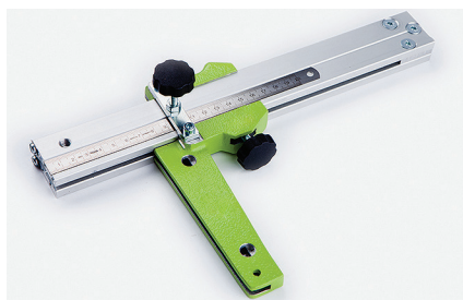
Полосорез Позволяет нарезать полосы заданной ширины.