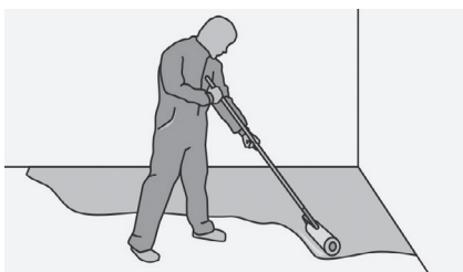
Рис. 20. Грунтование стяжки

Грунтовка и ровнитель – один производитель.