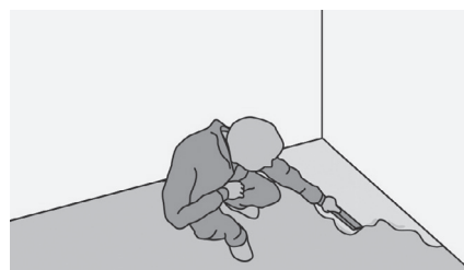
Рис. 21. Выравнивание оснований

Шпаклевочные массы необходимо шлифовать после высыхания и перед укладкой чистить пылесосом. Воздушные пузыри или попавшие комки, возникшие при размешивании или при работе мастерком, хорошо видны. Шлифовать необходимо по всей поверхности, включая труднодоступные места в углах, проемах и около стен.